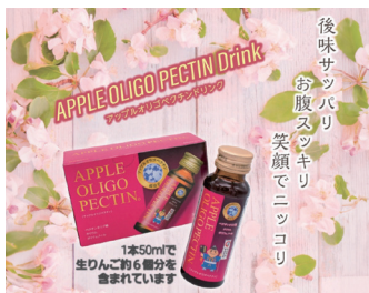
「APPLE OLIGO PECTIN ドリンク」