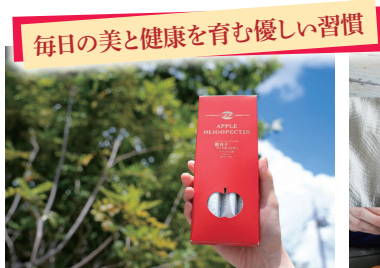
「Appleゼリー」1包で林檎6個分。