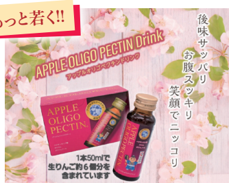
「APPLE PLIGO PECTIN ドリンク」