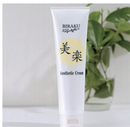
「BIRAKU Aesthetic Cream」 12,800円(税込)