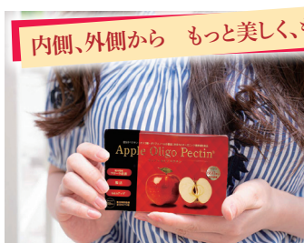
「Apple Eight」1箱で林檎エキス660個分。