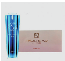
「ヒアルロン酸コラーゲン美容液」 16,800円(税込)